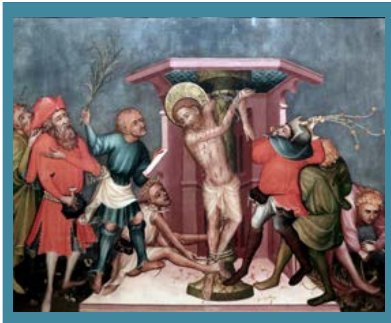
La Flagelación 1400-1410. Nuremberg. Museo Alemania