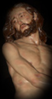
PASO DE LA CONDENA DE JESÚS A LOS AZOTES

La talla, de autor anónimo, está datada a finales del siglo XVI o principios del XVII. Fue la imagen con la que se fundó la Hermandad en el año 1804 para favorecer su culto público, y sale en una peana, que ha sido renovada varias veces, desde el año 1981. La actual es llevada a hombros por 12 cofrades. Lleva en el frontal un relicario con las reliquias de los Mártires Mercedarios de Aragón. La imagen fue cedida a la Cofradía en usufructo, por parte de las madres dominicas, en el año 2020 y se ha realizado un altar para que puede recibir culto en la iglesia de Santiago. caciones de forja en las terminaciones y en el escudo.