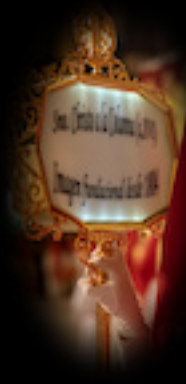
FAROL/ATRIBUTO DE PASOS

Son dos varas que acompañan a la bandera que se remata en una capilla que lleva dentro la imagen del Señor atado a la columna. Fueron realizadas en el taller de arte religioso Salmerón de Socuéllamos y fueron estrenadas en 2014.