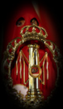
RELIQUIA DE LA SANTA COLUMNA

Salen dos: la de la Cofradía desde 1987 y la de la Hermandad desde 2004. Hacen presentes en la procesión, de una manera simbólica, a todos los hermanos difuntos, cuyos nombres van grabados en chapas adosadas. Se diferencian en el escudo que llevan en el frontal.