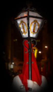
FAROLAS DE FORJA

Son cuatro artísticos faroles de mano que realizaron su primera salida procesional en 1957. Tienen gran valor ya que fueron realizados 1957 por la empresa Talleres Quintana. Son de metal dorado con cabezal octogonal de gran tamaño que llevan los cristales decorados.