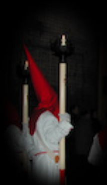
HACHONES DE FORJA

Tenemos tres y realizaron su primera salida procesional en 1993. Son unas cajas metálicas doradas compartimentadas para llevar el incienso y carboncillos. Fueron recortadas en 2019 para eliminarles peso.