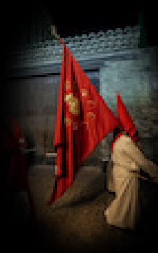
BANDERA DE LA HERMANDAD

Se estrenó en 2012. El cuerpo es de terciopelo rojo y lleva en la parte delantera el escudo y en el reverso el nombre de la Cofradía, todo ello bordado en oro. Va decorado con flecos dorados y rematado por el escudo.