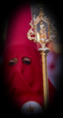
VARAS DE BANDERA

Son dos varas que acompañan a la bandera que se remata en una capilla que lleva dentro la imagen del Señor atado a la columna. Fueron realizadas en el taller de arte religioso Salmerón de Socuéllamos y fueron estrenadas en 2014.