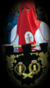
BANDERÍN DEL HERMANAMIENTO

Consta de tres paños o reposteros: uno grande en el centro y dos más pequeños en los laterales. Se incorporaron el año 1995. En el central puede leerse un versículo del evangelio de San Juan: "Tomó entonces Pilato a Jesús y mandó azotarle". Los laterales llevan bordados los símbolos de la Cofradía: los látigos y la columna.