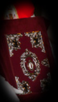
LIBRO DE ESTATUTOS

Tras el hermanamiento con la Agrupación de la Flagelación de la Cofradía California de Cartagena se realizó este banderín conmemorativo. Lleva bordados y orlados los escudos de las dos hermandades y sale en procesión desde 2001.