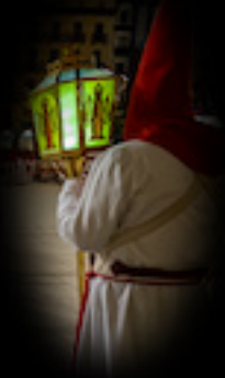
FAROLAS DE QUINTANA

El estandarte es el guion de la Cofradía y se estrenó en el año 1942. En el anverso lleva un óleo con la figura de Cristo atado a la columna sobre cuero y la inscripción "ET LIVORE EJUS SANATI SUMUS" ("con sus heridas hemos sido sanados"). En el reverso figura el nombre de la Cofradía con sus títulos, el escudo bordado en oro y la fecha de fundación.