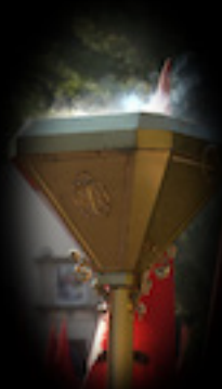
PEBETEROS DE MANO

El "Libro de Estatutos" o "Libro de Reglas" realizó su primera salida en el año 2001. Es de terciopelo rojo con aplicaciones plateadas y se lleva sobre una estructura de madera también forrada de terciopelo rojo.