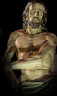
PASO DE LA FLAGELACIÓN