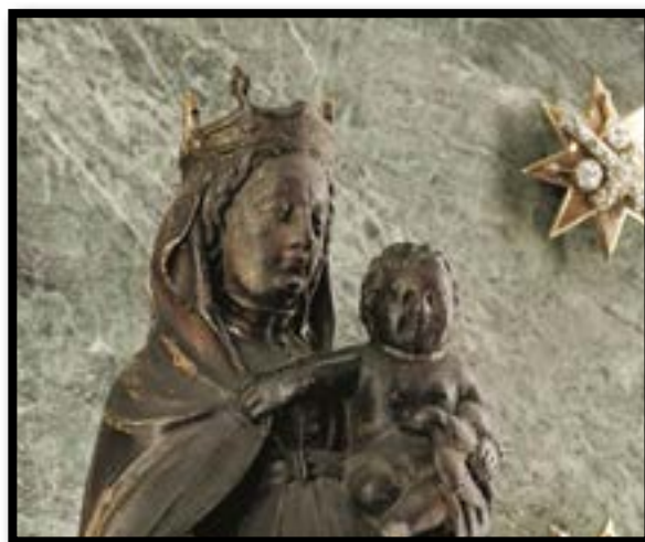
Figura 3.-Detalle de las coronas de la Virgen del Pilar y el Niño, en la imagen ofrecida a la Cofradía del Señor Atado a la Columna de Zaragoza. Fotografía cortesía de la Hermandad. Figura 4.-Talla de la Virgen del Pilar que se venera en la actualidad, cortesía del Cabildo del Pilar.