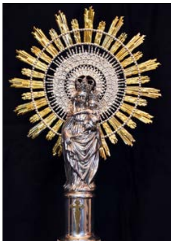
Figura 2.-Detalle de la imagen de la Virgen del Pilar en plata ofrecida a la Cofradía del Señor Atado a la Columna de Zaragoza.

Las dependencias de la Hermandad se sitúan sobre la Iglesia de Santiago el Mayor (o antigua iglesia del convento de San Ildefonso en la Avenida de César Augusto) y están repletas de ricas joyas y objetos litúrgicos, que desprenden y materializan la devoción de sus cofrades. La Cofradía, cuyos primeros estatutos datan de 1804, dispone de un tesoro ciertamente notable en torno al culto de las dos figuras cotitulares de la Hermandad, que se exhiben para su veneración popular, desde 1977, en un altar propio situado en una capilla de la citada parroquia de Santiago. Esta Virgen de plata pasará a formar parte del tesoro expuesto en el Museo de la Cofradía, donde se custodian reposteros, estandartes, cruces procesionales, relicarios, pebeteros y faroles, entre otros objetos litúrgicos.