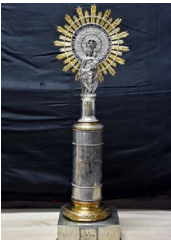
Figura 1.-Imagen de la Virgen del Pilar en plata ofrecida en 2011 a la Cofradía del Señor Atado a la Columna de Zaragoza (79 x 20 cm.).