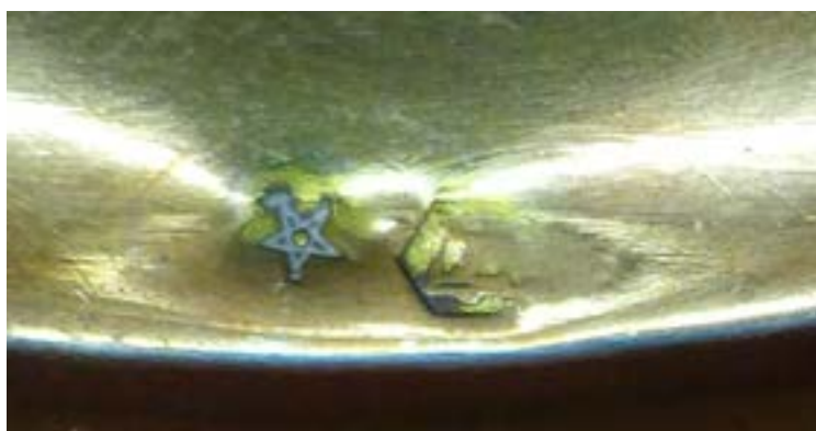
Figura 7.-Detalle de los punzones situados en la peana sobredorada de la imagen en plata de la Virgen del Pilar de la Cofradía del Señor Atado a la Columna de Zaragoza.

La talla de la Virgen en plata, con su Pilar, mide 27 cm. de alto. En el Pilar, se dispuso sobrepuesta una Cruz de Santiago sobredorada, en honor a Santiago el Mayor que predicaba a orillas del Ebro en el momento en que la Virgen vino en carne mortal a Zaragoza. La Virgen apoya a su vez en otro Pilar más grande, de 32 cm. de alto, que muestra de nuevo la cruz de Santiago aplicada en relieve, pero esta vez en plata de su color. En esta cruz se acusan mejor los extremos flordelisados y la espada con que suele representarse en su parte baja. En las intersecciones de la cruz se grabaron resplandores en bajorrelieve, con la clásica decoración de rayos recortados. Este gran Pilar combina distintas molduras redondeadas cinceladas en relieve sobredorado, con decoraciones incisas grabadas en el fondo de plata, dotando de gran plasticidad a la imagen. En las molduras sobredoradas se labraron guirnaldas triunfales compuestas por hojas dentadas de roble, mientras cuatro cenefas perladas encierran una decoración floral incisa enmarcada por roleos vegetales, a modo de acantos. El fabricante marcó dos veces la pieza en este gran Pilar: una especie de trapecio en el interior de un hexágono, además de incorporar la estrella de David de cinco puntas, el punzón que identifica la pieza como de plata, utilizado entre 1930 y 1980 (Figura 7).