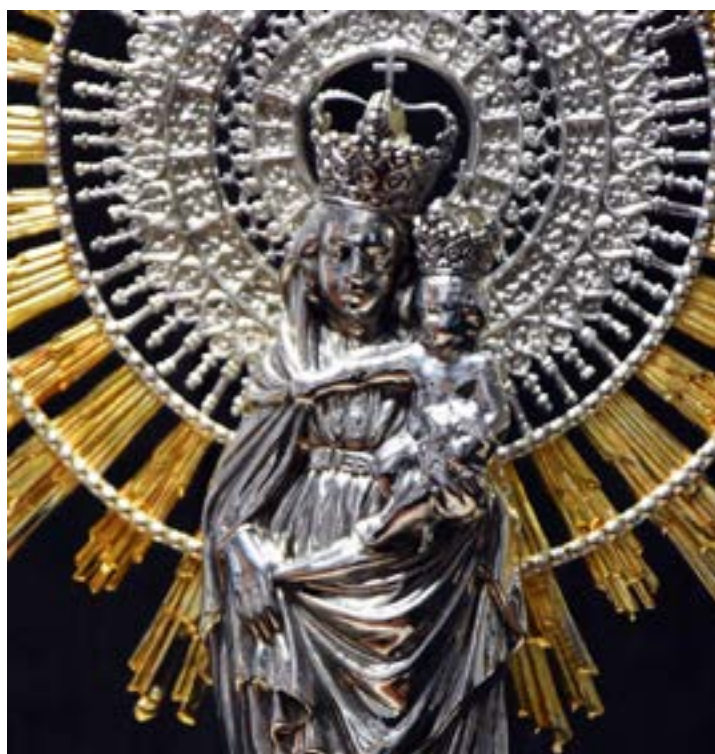
Figura 6.-Detalle de coronas, sobrehalo y resplandor de la Virgen del Pilar y el Niño de la Cofradía del Señor Atado a la Columna de Zaragoza.

La talla de la Virgen en plata, con su Pilar, mide 27 cm. de alto. En el Pilar, se dispuso sobrepuesta una Cruz de Santiago sobredorada, en honor a Santiago el Mayor que predicaba a orillas del Ebro en el momento en que la Virgen vino en carne mortal a Zaragoza. La Virgen apoya a su vez en otro Pilar más grande, de 32 cm. de alto, que muestra de nuevo la cruz de Santiago aplicada en relieve, pero esta vez en plata de su color. En esta cruz se acusan mejor los extremos flordelisados y la espada con que suele representarse en su parte baja. En las intersecciones de la cruz se grabaron resplandores en bajorrelieve, con la clásica decoración de rayos recortados. Este gran Pilar combina distintas molduras redondeadas cinceladas en relieve sobredorado, con decoraciones incisas grabadas en el fondo de plata, dotando de gran plasticidad a la imagen. En las molduras sobredoradas se labraron guirnaldas triunfales compuestas por hojas dentadas de roble, mientras cuatro cenefas perladas encierran una decoración floral incisa enmarcada por roleos vegetales, a modo de acantos. El fabricante marcó dos veces la pieza en este gran Pilar: una especie de trapecio en el interior de un hexágono, además de incorporar la estrella de David de cinco puntas, el punzón que identifica la pieza como de plata, utilizado entre 1930 y 1980 (Figura 7).