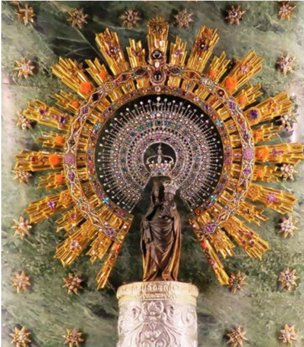
Figura 5.-Talla de la Virgen del Pilar que se venera en la actualidad, aderezada con el conjunto ofrecido por las Damas de su Corte de Honor, con motivo de la Coronación Canónica de la Virgen (1905).

Los aderezos de la imagen en plata (Corona, Coronita, sobre halo y resplandor), estos últimos metálicos y desmontables, emulan el aderezo completo de cuatro piezas, que se ofreció a la Virgen del Pilar con motivo de su Coronación Canónica (1905); un conjunto de cuatro riquísimas piezas que viste a la imagen el día de su fiesta mayor y cada uno de enero (Figura 5).