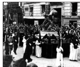
EL PASO DEL SEÑOR ATADO A LA COLUMNA

Lo puedes adquirir en el local social al precio de 10 euros.