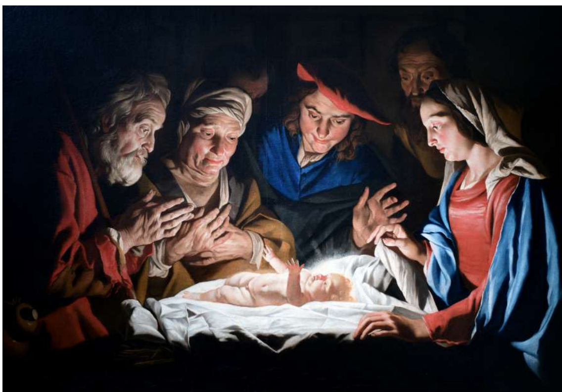
Matthias Stomer. Adoración de los pastores. 1650. Palacio Madama. Turín.

BELÉN DE NAVIDAD y ÁGAPE: Tras finalizar la eucaristía tendrá lugar la bendición del Belén, acto que acompañaremos cantando unos villancicos. A continuación tomaremos un pequeño ágape para compartir un rato todos juntos, cofrades y parroquianos, y desearnos unas felices fiestas de Navidad.