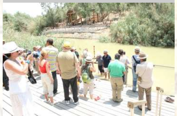
Fotografía inferior: Renovación de las promesas del Bautismo en el río Jordán