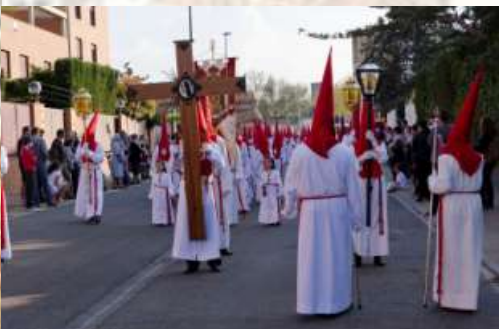
La nueva calle de la Cofradía durante la salida de la Procesión del Traslado, la pasada Semana Santa.