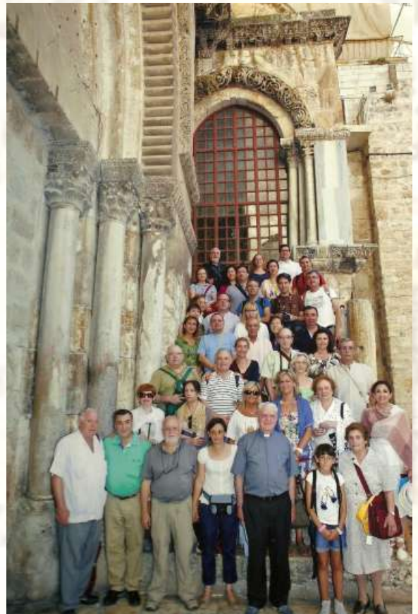
Fotografía superior: Peregrinación al completo en la Basilica del Santo Sepulcro.

Pero cómo poder trasladar aquí los sentimientos vividos al rezar el Ángelus donde María recibió al ángel, cómo expresar lo sentido al celebrar la Navidad y cantar villancicos en pleno mes de Julio en la cueva de los pastores o en la Gruta de Belén. ¿Qué nos pasó a todos los que fuimos la noche que estuvimos en el huerto de los