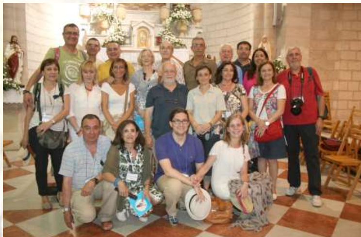
Fotografía superior, renovación del Sacramento del Matrimonio en Caná.

olivos celebrando una hora santa? ¿Cómo explicar lo que se siente al participar en una eucaristía en el monte calvario?. ¿Qué nos vino a la cabeza al recorrer la Vía Dolorosa rezando un Vía-Crucis como creo que nunca haremos?