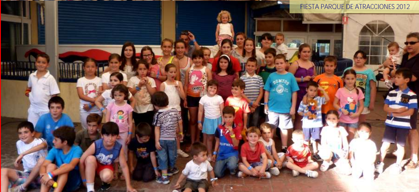
FIESTA PARQUE DE ATRACCIONES 2012

Si lo deseas puedes visualizar estas fotos y más en la pestaña de noticias de nuestra web www.cofradiacolumzagz.com