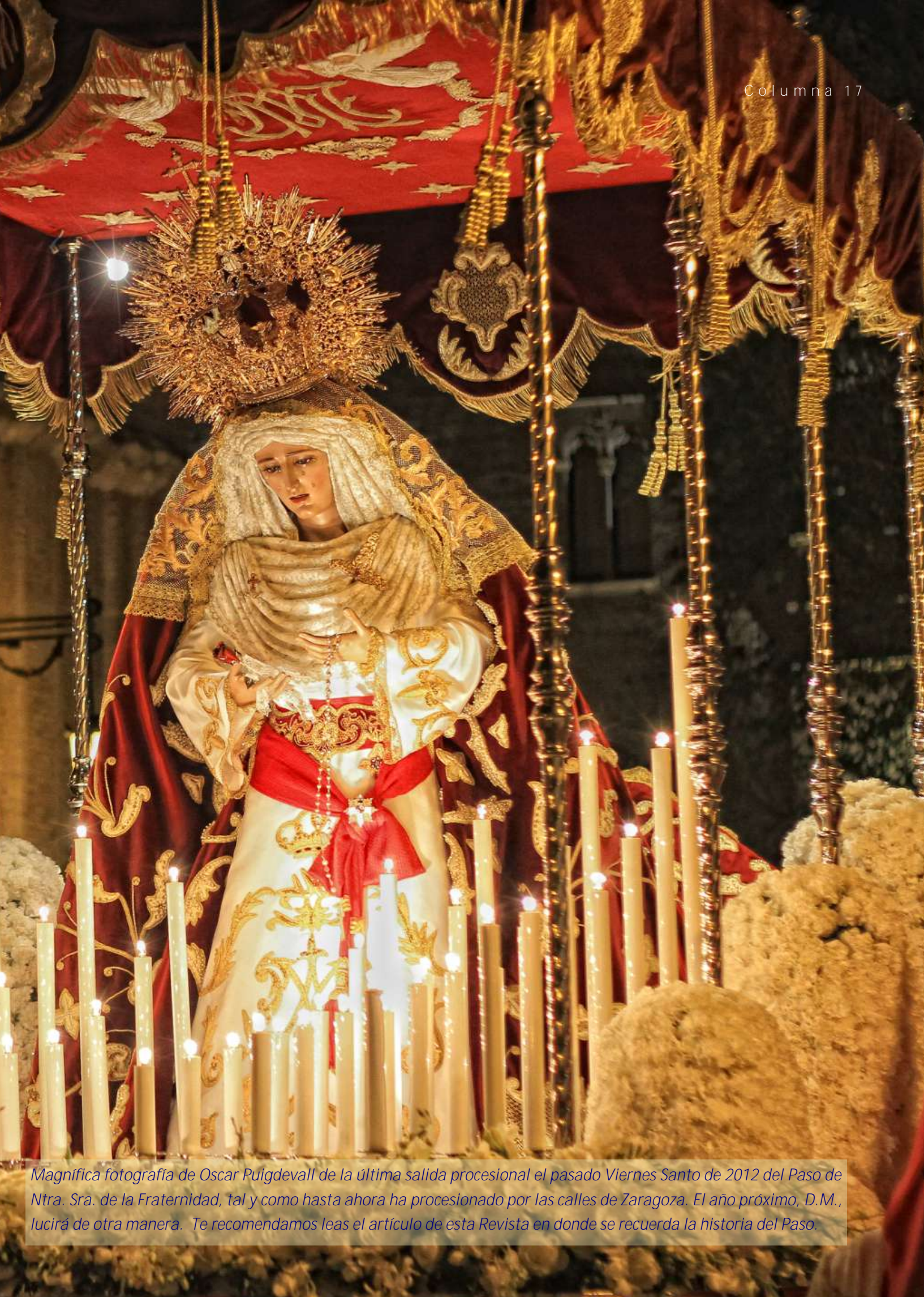
Magnífica fotografía de Oscar Puigdevall de la última salida procesional el pasado Viernes Santo de 2012 del Paso de Ntra. Sra. de la Fraternidad, tal y como hasta ahora ha procesionado por las calles de Zaragoza. El año próximo, D.M., lucirá de otra manera. Te recomendamos leas el artículo de esta Revista en donde se recuerda la historia del Paso.