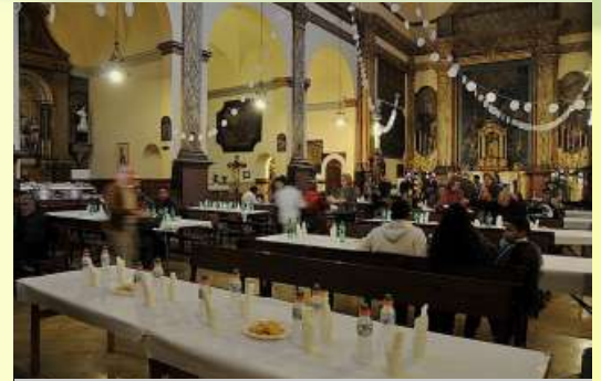
En Nochebuena, la Iglesia de los Capuchinos de Palma de Mallorca se convierte en un comedor para aquellos que carecen de medios para celebrar ese día. Hay docenas de voluntarios que preparan la cena y hasta un grupo musical para amenizar la fiesta.