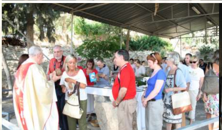
Dos fotografías curiosas:

Arriba, celebración de la Navidad en pleno mes de Julio; A la derecha, el anterior y el actual Hno. Mayor de la Cofradía, juntos en la reliquia de la Santa Columna.