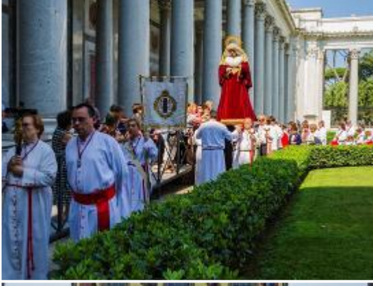
Procesión y Via Matris por los jardines de San Pablo extramuros.