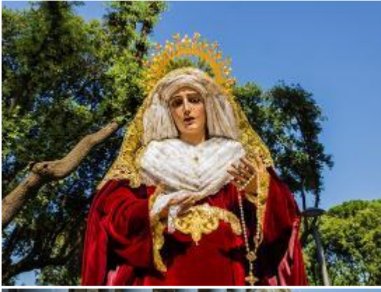
Cuarto día. San Pablo extramuros.