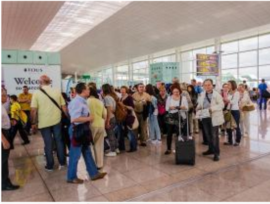
Preparados para embarcar en el vuelo de Airlitalia que nos llevaría a Roma