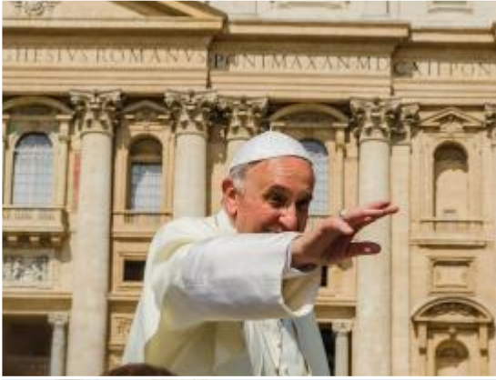
Momento de emoción máxima por la proximidad y cercanía de su santidad.