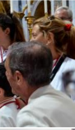
La proximidad del Cardenal y su cercanía nos dejó un recuerdo inenarrable.