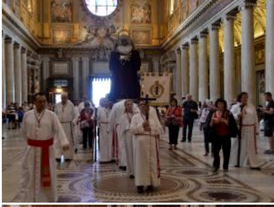
Emoción contenida a la entrada de la Basílica de Santa María La Mayor.