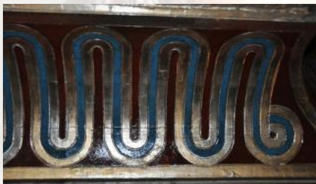
RESULTADO DE LA ACTUACIÓN TRAS LA RESTAURACIÓN

La restauración ha consistido en una limpieza química del barniz oxidado y una ligera limpieza mecánica de su superficie. Debido a las dimensiones, a los diferentes relieves de los elementos de la peana y a la composición de las técnicas utilizadas para su recubrimiento, este procedimiento ha sido muy lento y laborioso.