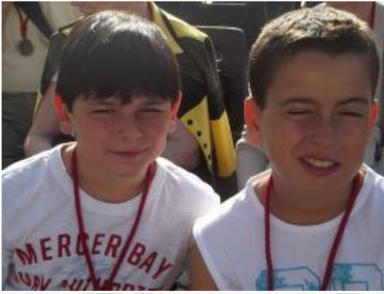
Los jóvenes cofrades a la espera para poder ver al Papa con sus medallas.