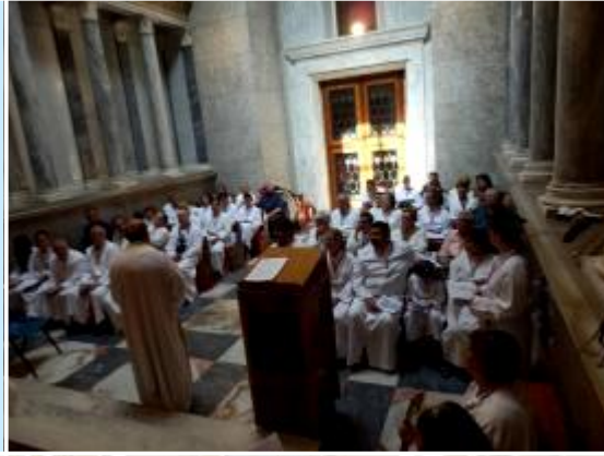
Eucaristía emocionada en una de las Capillas de San Pablo.