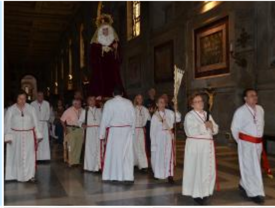
Entrada silenciosa en el interior de la Basílica de San Pablo