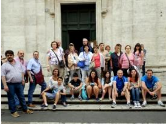
Primera tarde de ocio. Visita a la iglesia de San Luis de Francia