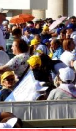
El sol castigaba con justicia la espera.