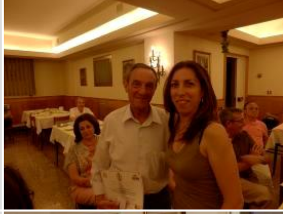
Noche de jueves: compartiendo sensaciones y entrega de recuerdo de la peregrinación.