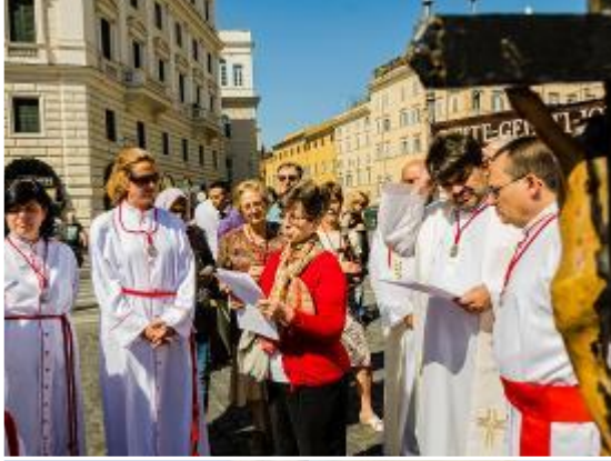
Rezo del Via Matris