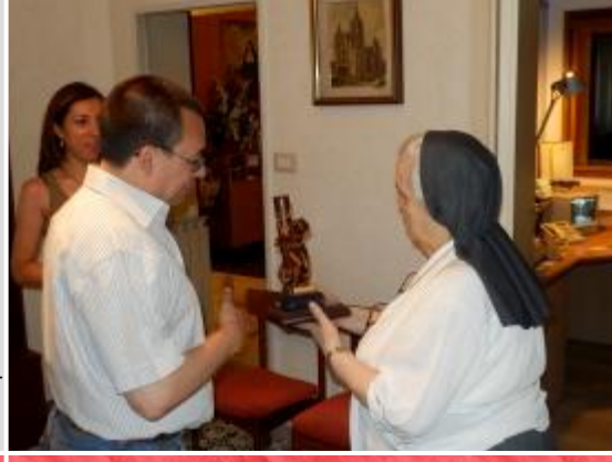
Viernes por la mañana: recuerdo a la Congregación que nos abrió sus puertas.