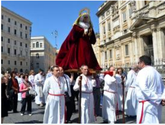
Segundo día: Alrededores de la Basílica de Santa María La Mayor.