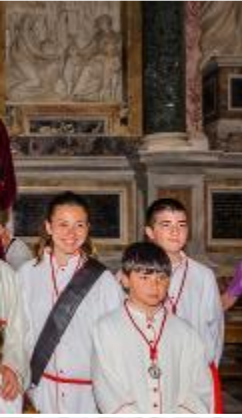
El Cardenal Santos Abril con los chicos y chicas de la Cofradía.