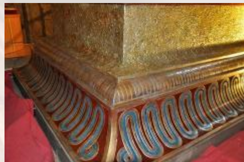
ESTADO PREVIO A LA RESTAURACIÓN

La base está realizada en madera tallada, compuesta por la unión de diferentes piezas. Presenta distintos acabados: unas zonas están recubiertas con pintura dorada, otras policromadas con pigmentos al temple, y otras con plata corlada. La corladura consiste en la aplicación de un barniz coloreado transparente sobre una superficie plateada bruñida, que se aplica a modo de veladuras con la finalidad de obtener la apariencia del oro sobre superficies plateadas, reduciendo de este modo los costes económicos derivados del uso de dicho metal.