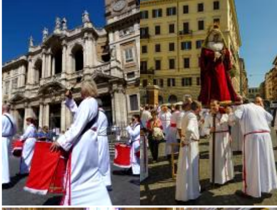
Parte de la Semana Santa de Zaragoza Procesionando por las calles de Roma.