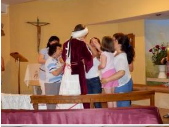
Preparando a Nuestra Señora De La Fraternidad.