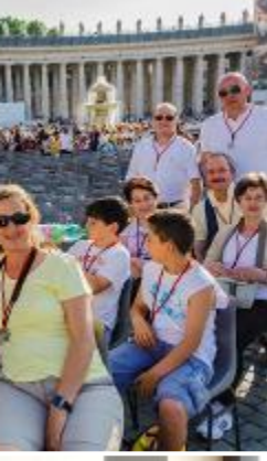
Miércoles. El día grande de la Peregrinación. A la espera de ver al papa Francisco.