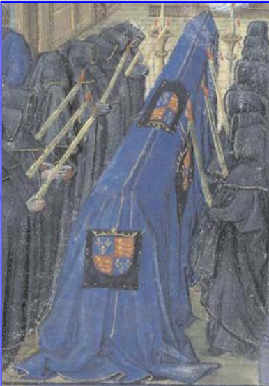
Figura 2. (Apreciar que han cambiado los colores y los adornos)

Así como en los magníficos funerales de Guillermo el Conquistador en la "Grande Chronique de Normandie" de hacia 1465. (Fig.2).