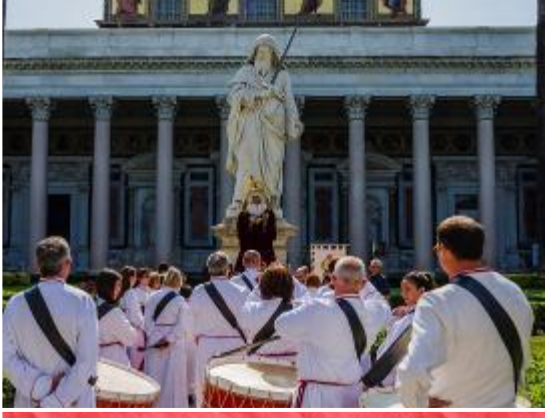
Impresionante imagen de San Pablo. A sus pies Nuestra Señora de la Fraternidad.