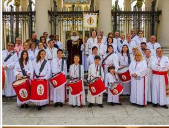
Fotografía de recuerdo a las puertas de la impresionante Basílica de San Pablo.