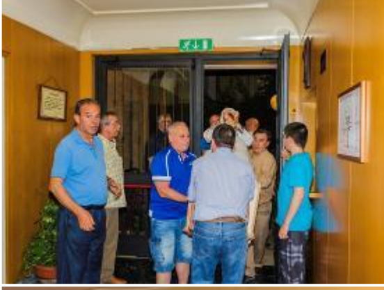
Entrando la imagen de Nuestra Señora De La Fraternidad en la residencia.