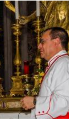
Entrega de la reproducción del paso Titular A su eminencia el Cardenal Santos Abril.