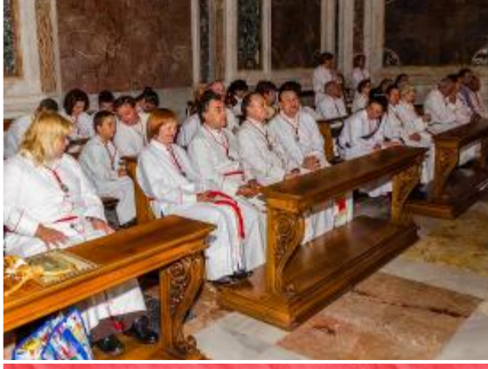
Eucaristía en la recién restaurada capilla de la Basílica de Santa María La Mayor.