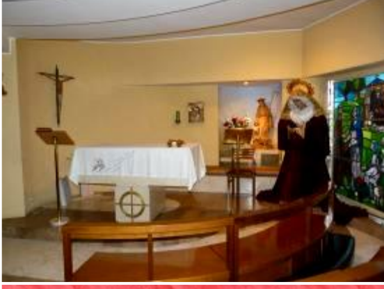
Capilla con la imagen de Nuestra Señora de la Fraternidad.