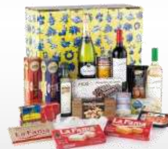
(*) fotografía orientativa del premio

Al final del juego, a todos los participantes se les invitará a un “pequeño aperitivo”