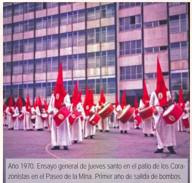
Año 1970. Ensayo general de jueves santo en el patio de los Corazonistas en el Paseo de la Mina. Primer año de salida de bombos.