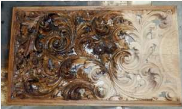
Una de las piezas que conformarán el conjunto de la nueva greca en proceso de barnizado